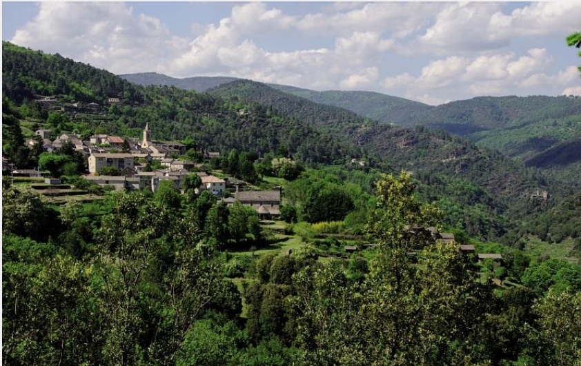
Vue de Saint-Germain-de-Calberte