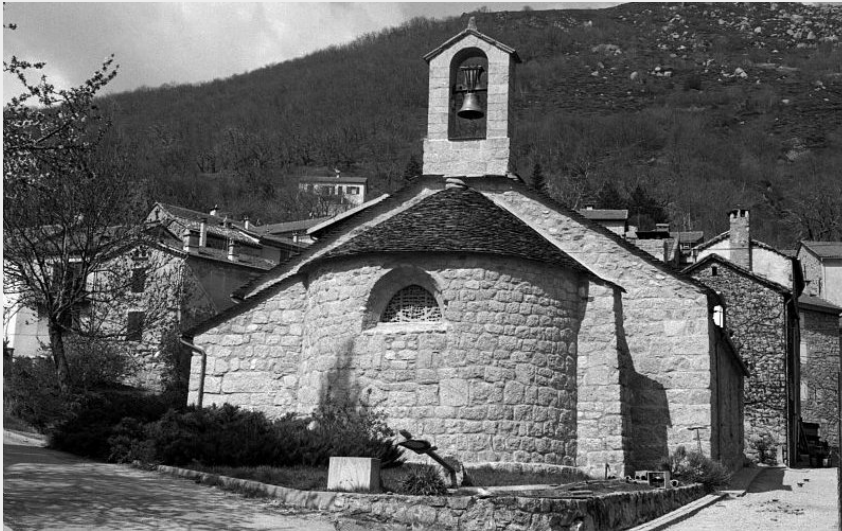
Temple de Vialas