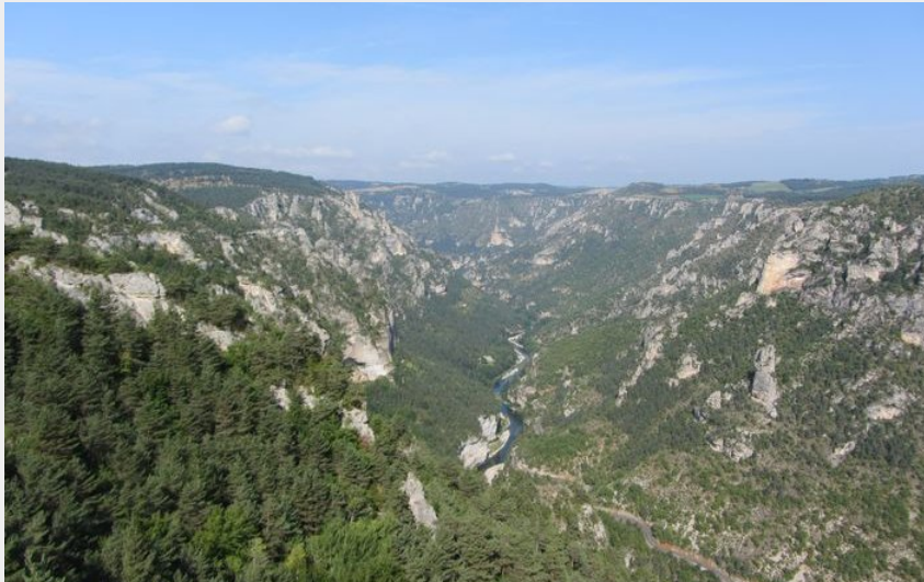
Vue sur les gorges du Tarn depuis le sentier