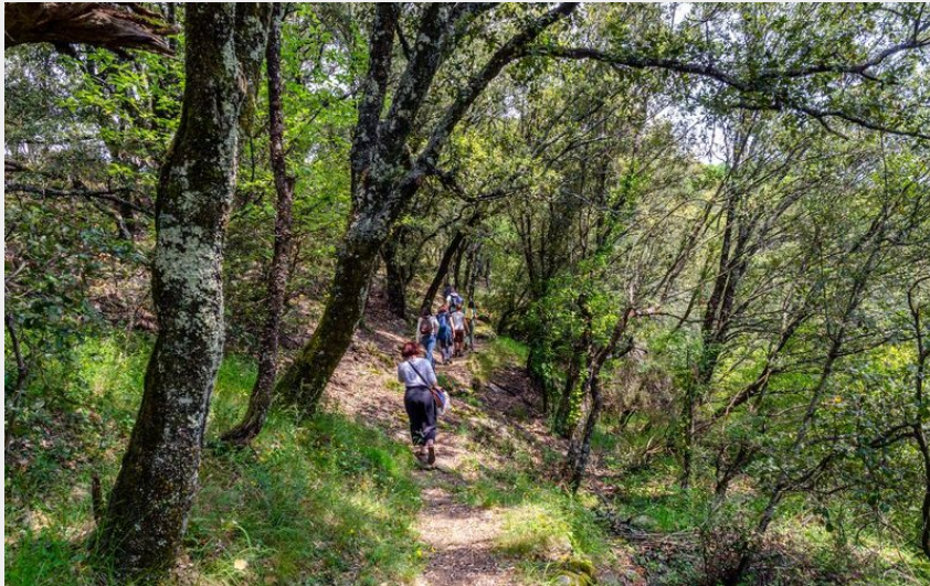
Sur la voie verte (Olivier Prohin)