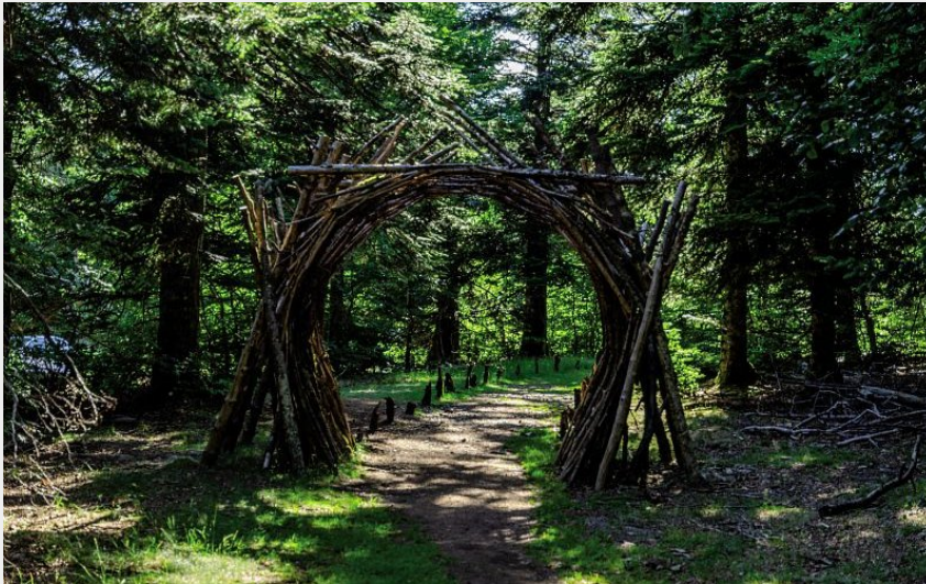
L'orée, porte d'entrée du parcours landart