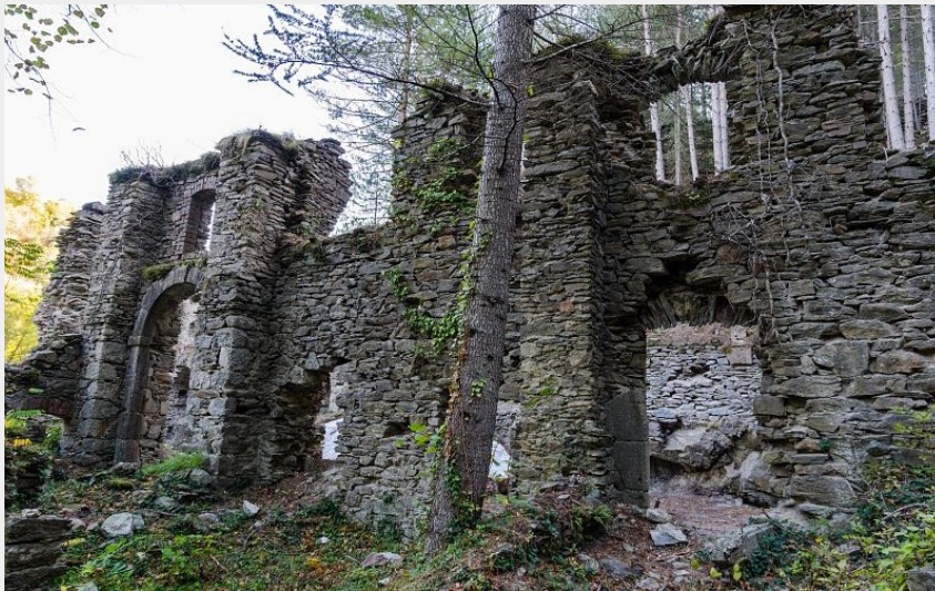
Usine du Bocard