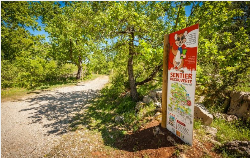
Départ du sentier (Grotte de la Cocalière)