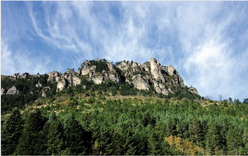
Le Rochefort, Florac