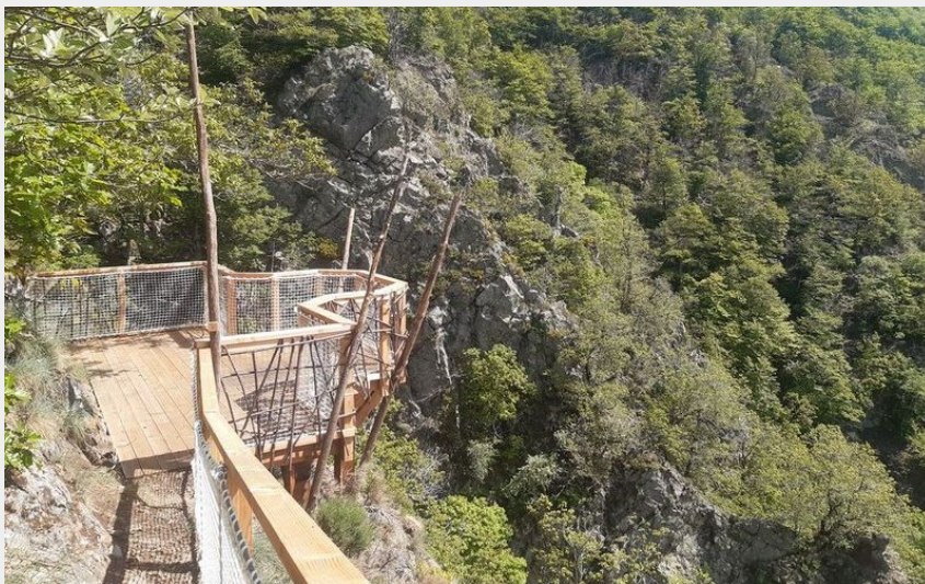
Béledère des cascades de l'Hérault