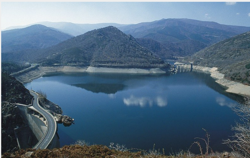
Lac de Villefort