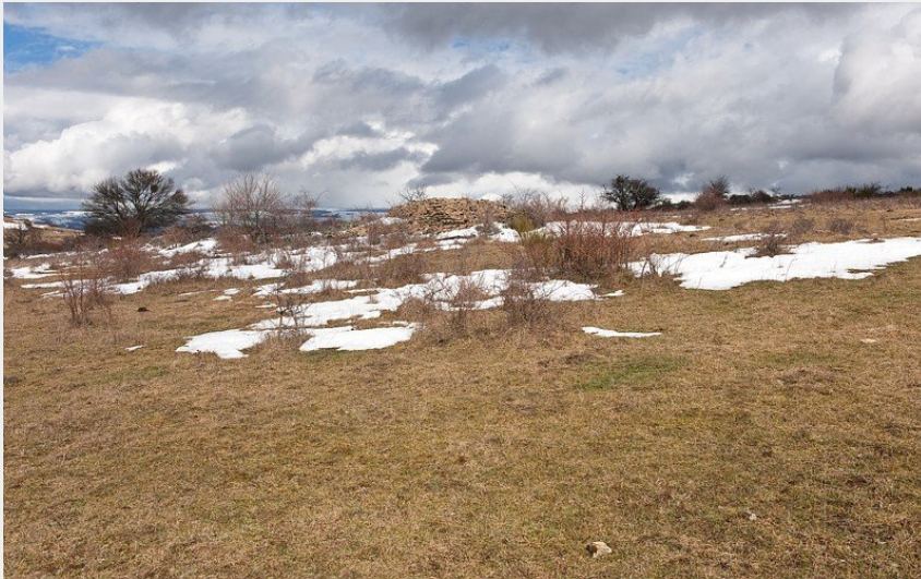
La Can de Ferrières