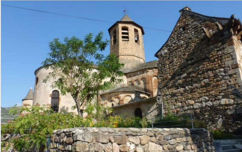
L'Eglise d'Ispagnac