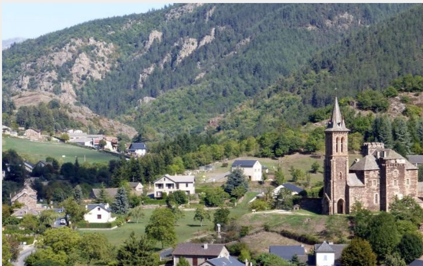
Vue sur Bédouès