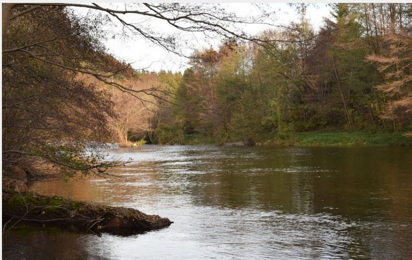
Le Tarn à Bédouès