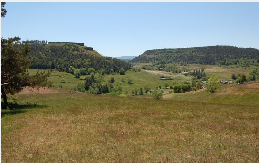
Barre des Cévennes