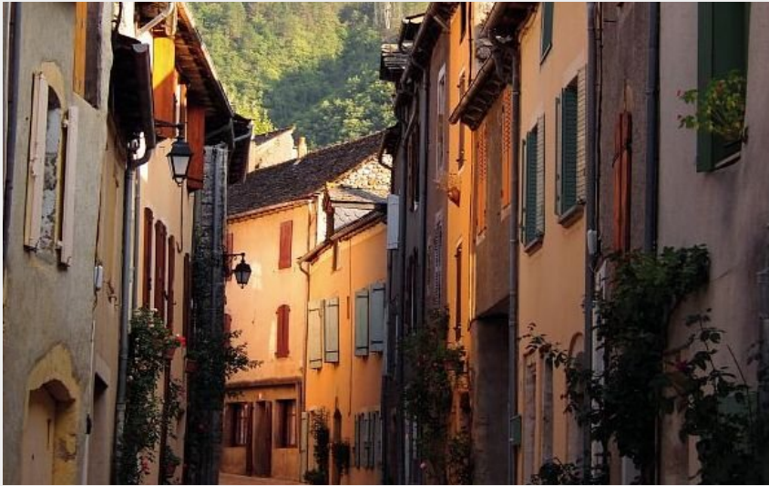
Les ruelles d'Ispagnac (Francis Fayet)