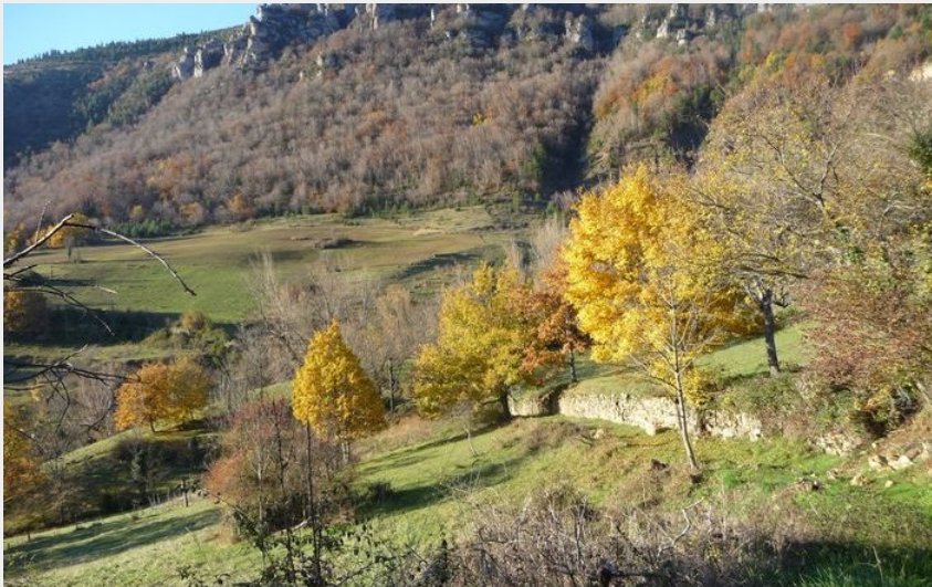
Vue sur les corniches