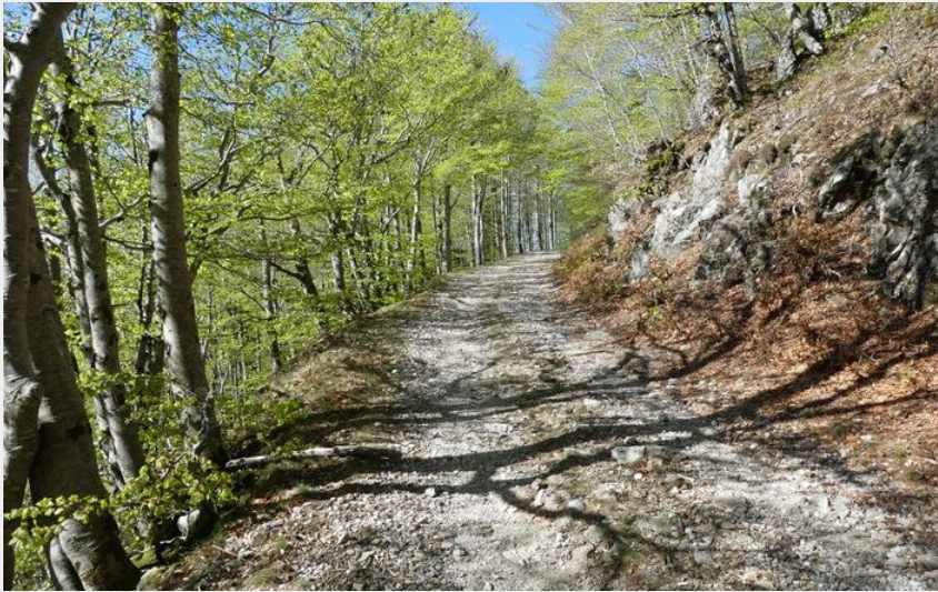
La forêt de hêtre (nathalie.thomas)