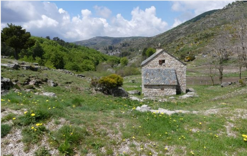
Le parc moutonnier (nathalie.thomas)