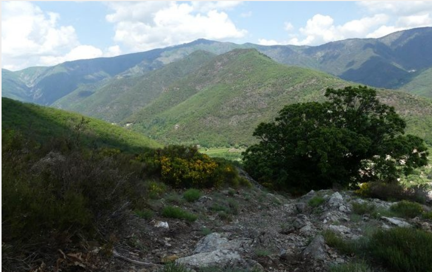
Vue sur l'Aigoual et ses contreforts