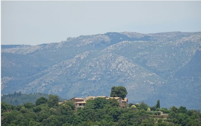
Le hameau du Puech