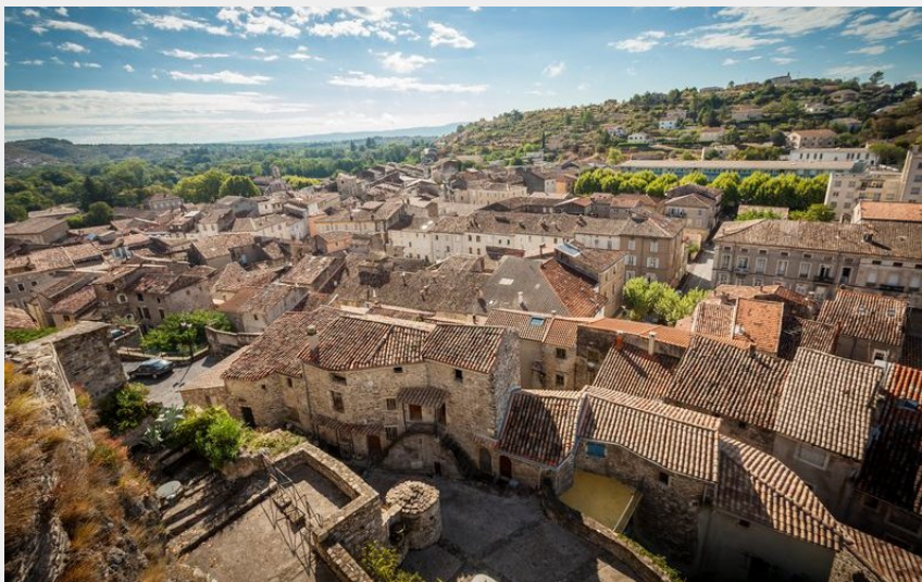
Vue sur Saint-Ambroix