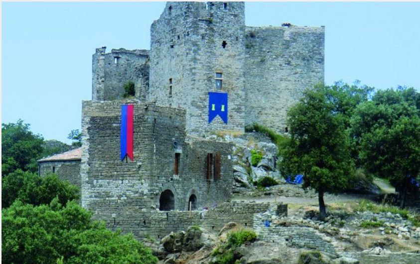
Château de Montalet