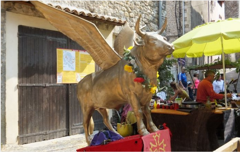
Saint-Ambroix, Volo biou