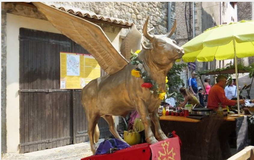
Saint-Ambroix, Volo biou