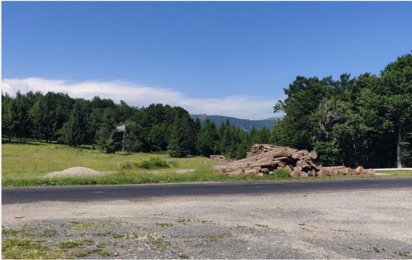
Une belle percée vers l'Aigoual et son observatoire (Béatrice Galzin)