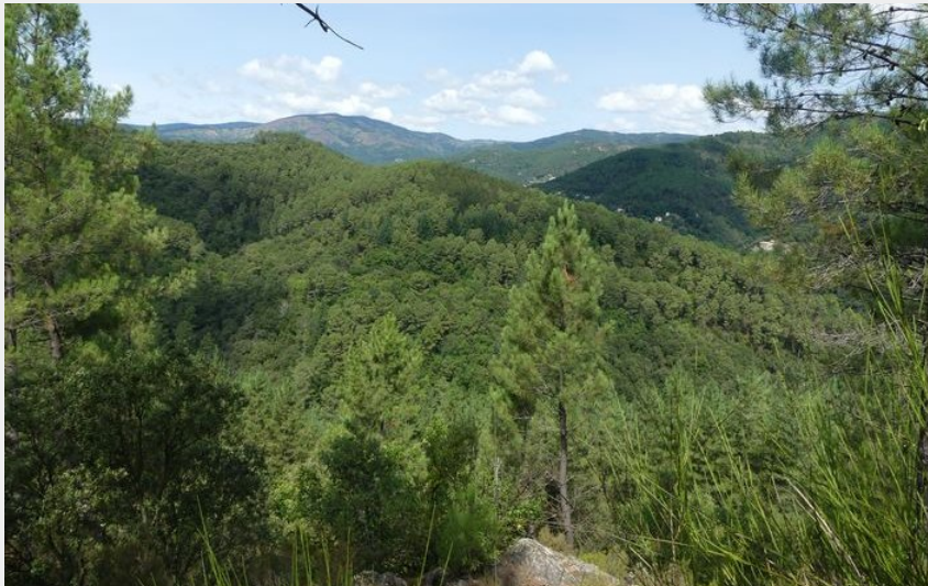
Vue sur le Signal de Ventalon