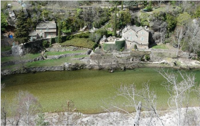
La Fontaine (nathalie.thomas)