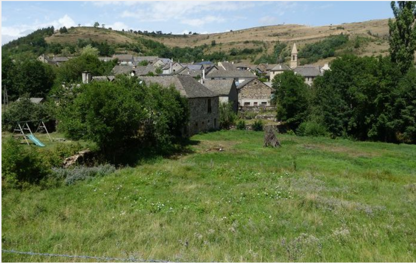
Cubières (© Nathalie Thomas)