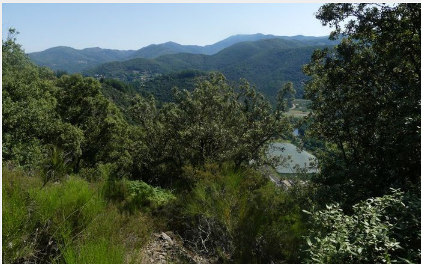
Vue sur la vallée de l'Hérault (Nathalie Thomas)