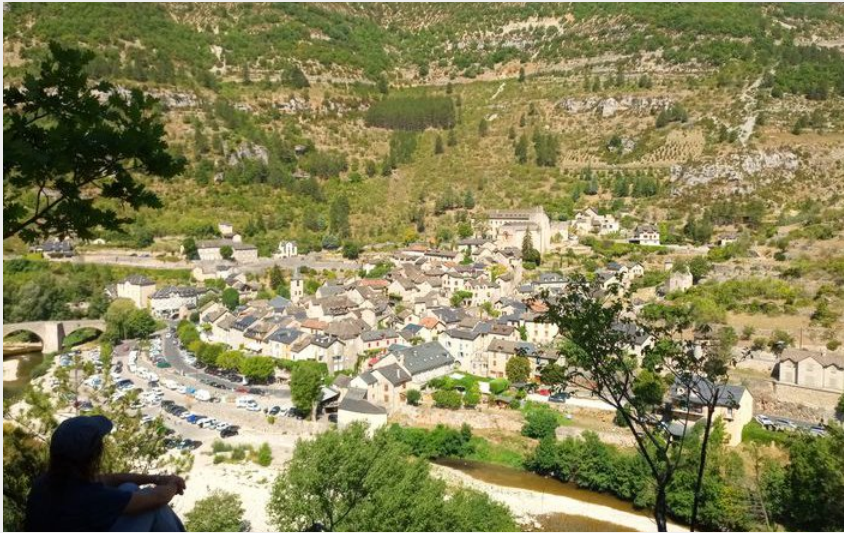
Vue sur Ste-Enimie (Nathalie Thomas)