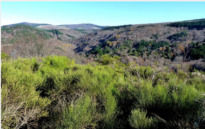
Vallée du Trévezel