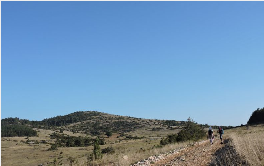
Le Puech d'Alluech