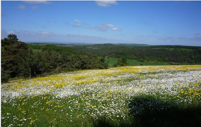
Les prairies avant la forêt (Michel Monnot)