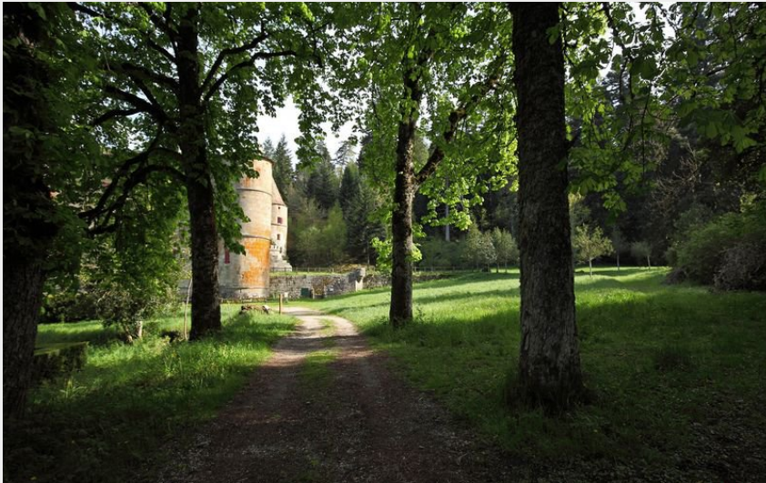
Château de Roquedols