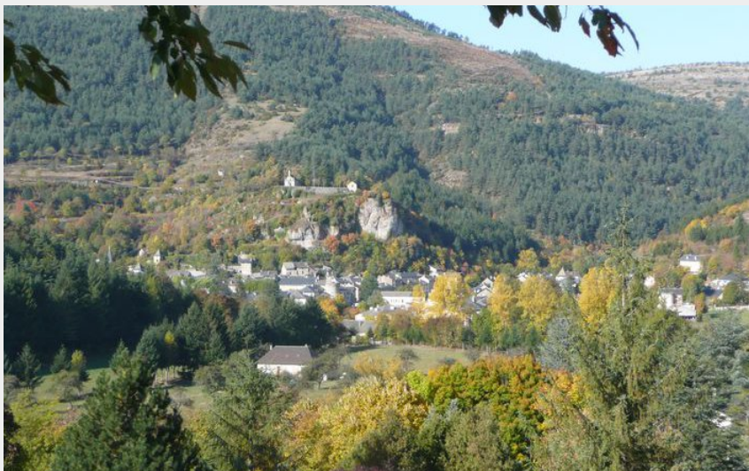
La cité de Meyrueis (Nathalie Thomas)