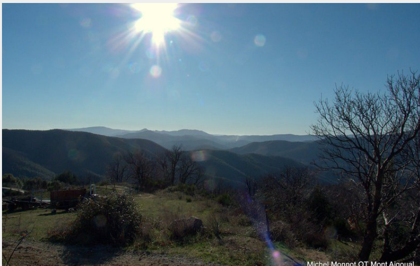
Vue de Puech Sigal vers le Pic d'Anjeau, les Rochers de la Tude et la Serrane (Michel Monnot)