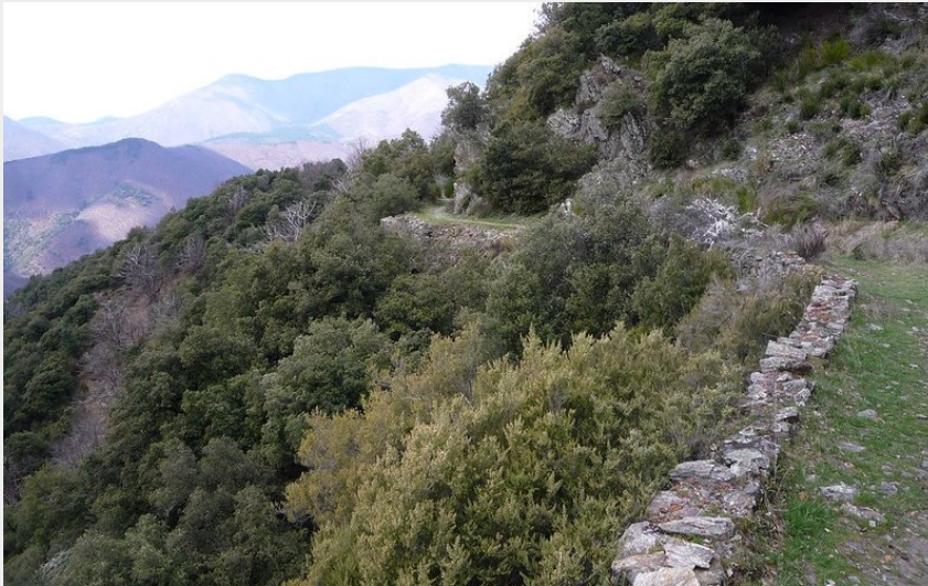
Chemin des chars vers Fenouillet (Michel Monnot)