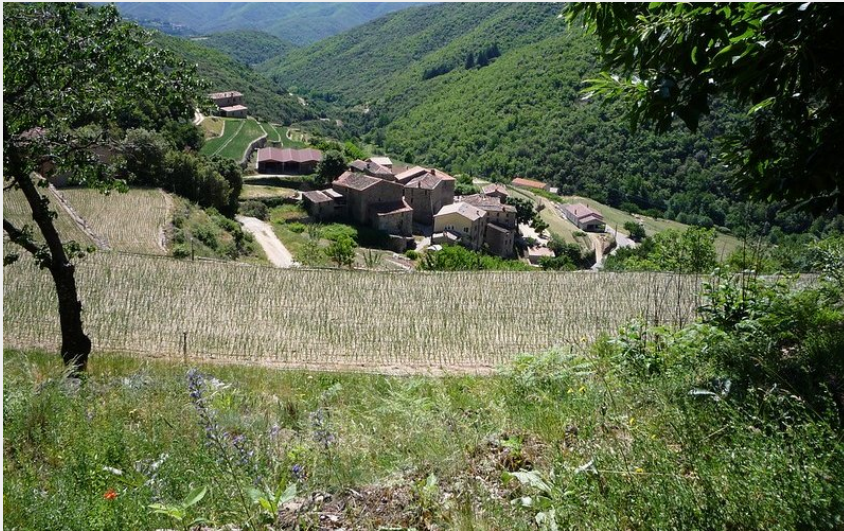
Village de Taleyrac (Michel Monnot)