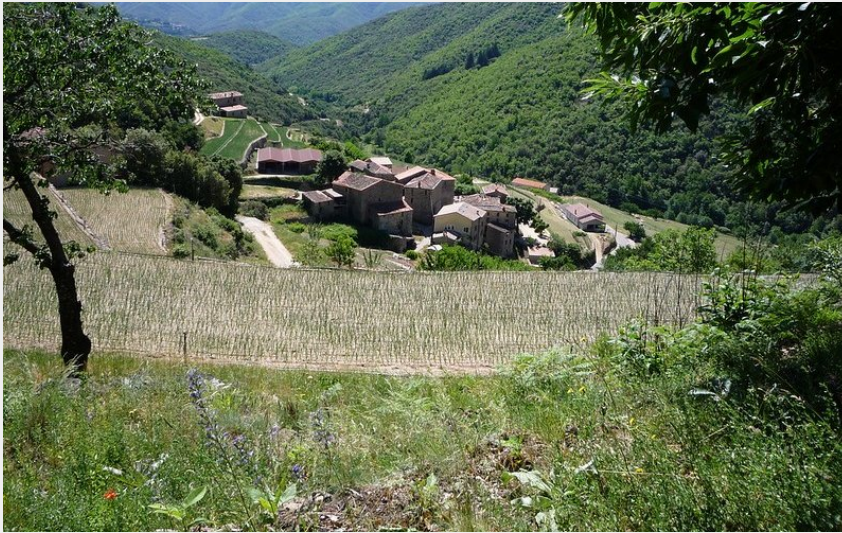
Village de Taleyrac (Michel Monnot)