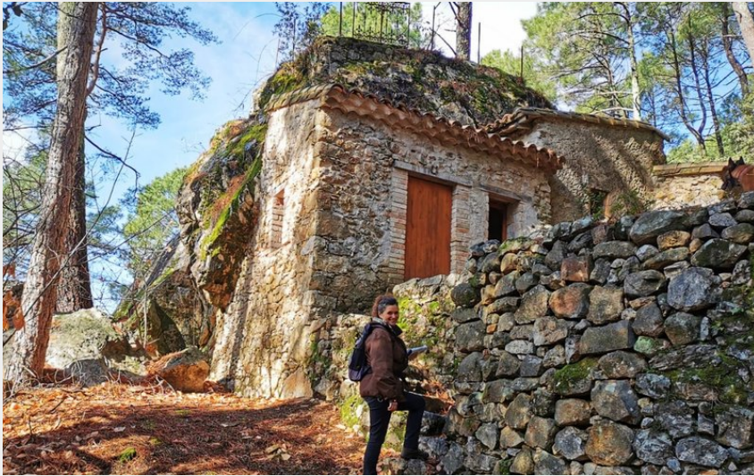
Bosquet du souvenir sur le chemin (Beatrice Galzin)