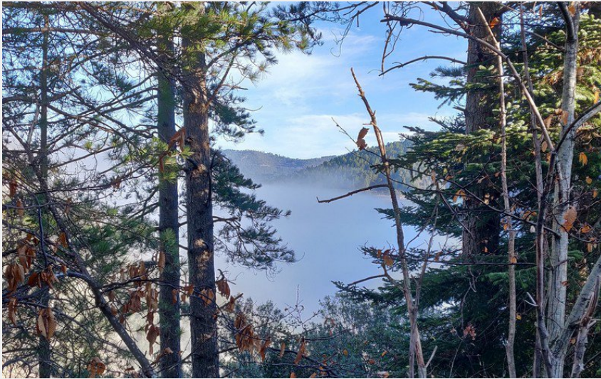
Sur la petite route (Béatrice Galzin)