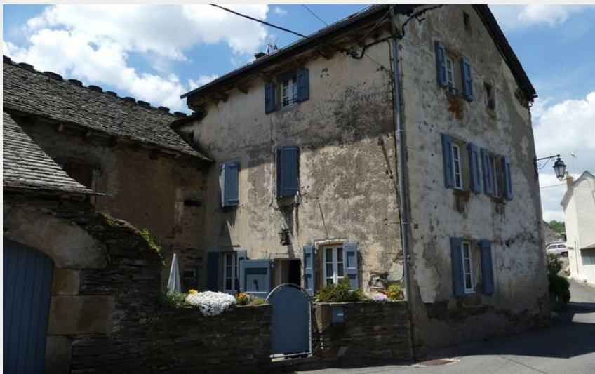
Bagnols les Bains (N Thomas)