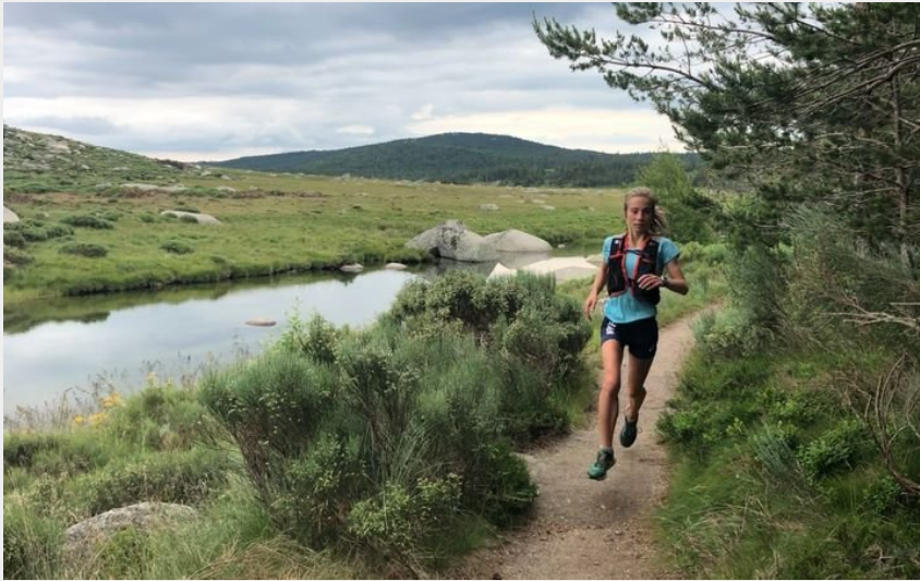
Traileur le long du Tarn