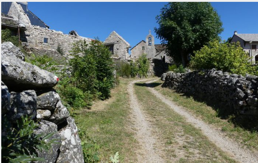
La Fage