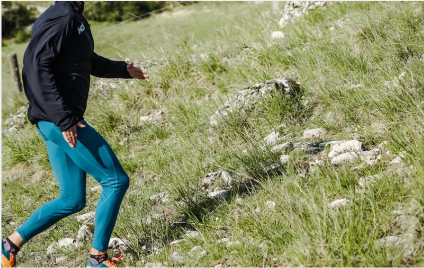
Traileur en montée