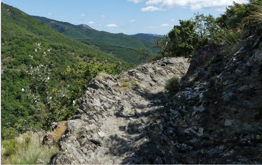
Descente dur Bréau (N. Thomas)