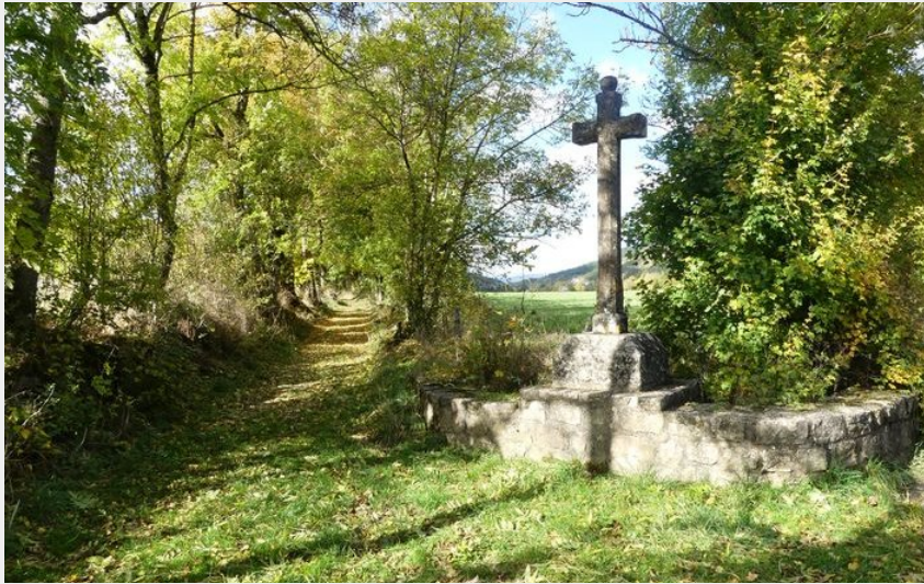
Croix autour de Chadenet