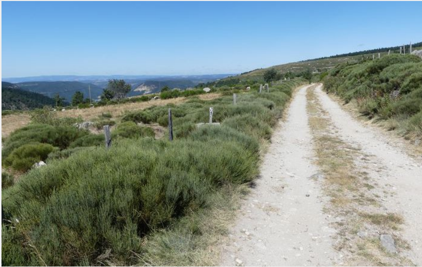
Paysage du mont Lozère (Nathalie Thomas)