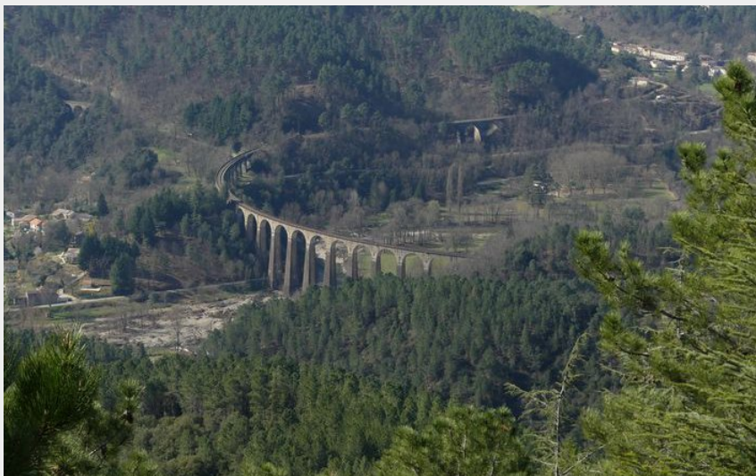
Vue sur le viaduc (Nathalie Thomas)