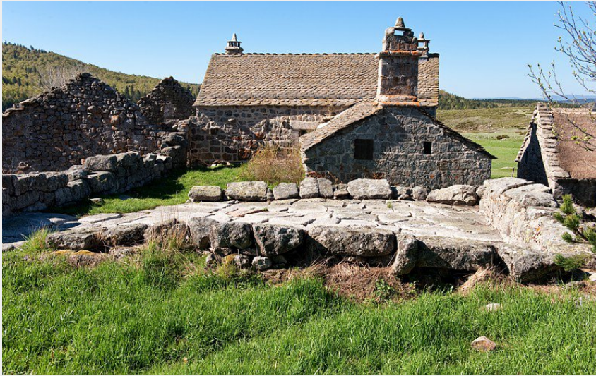
Bellecoste, Aire à battre (Guy Grégoire)