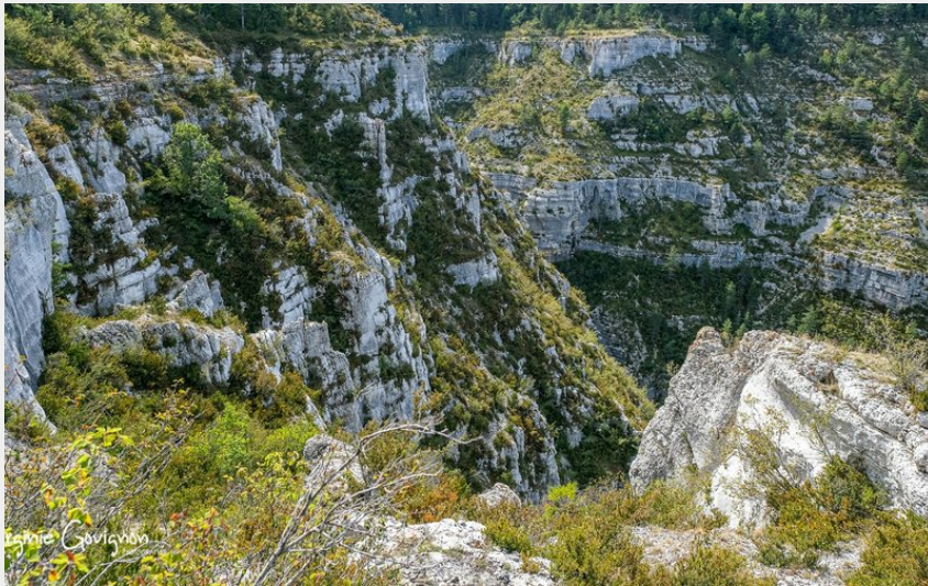
paysage Gorges du Tarn (Virginie Govignon)